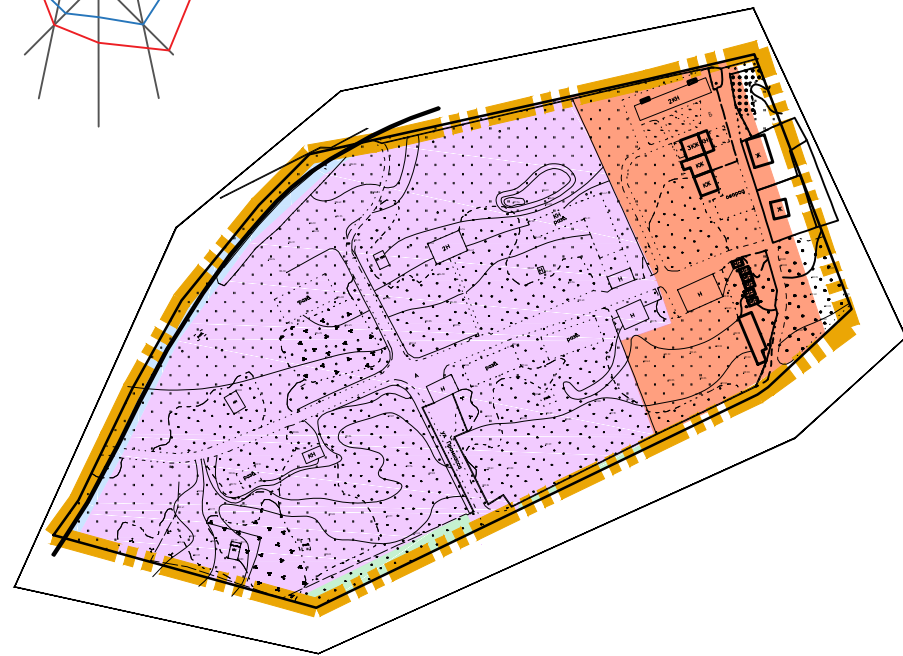
Схема зон функционального назначения в соответствии с Генеральным планом г. Смоленска

Условные обозначения в соответствии с Генеральным планом г. Смоленска