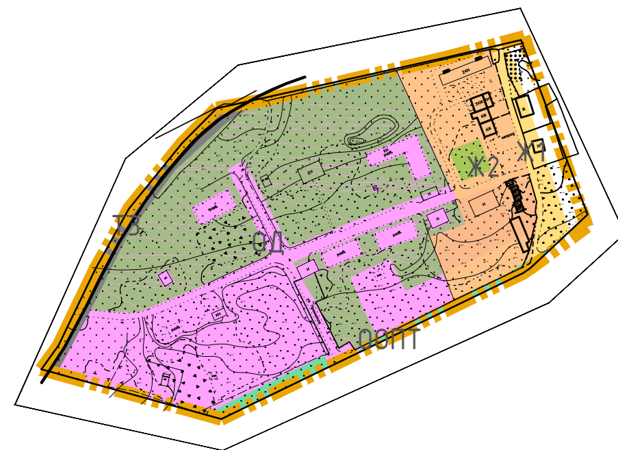
Схема с отображением границ территориальных зон в соответствии с Правилами землепользования и застройки г. Смоленска

Условные обозначения в соответствии с Правилами землепользования и застройки г. Смоленска